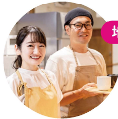
地域ならではの働き方

能登の震災復興から、ふるさとワーホリ、阿波踊りまで！希望の関わり方を探すところから！