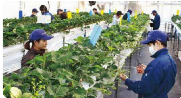
イチゴの生育調査

主 穀 作：水稻・大麦・大豆 園芸作物：白ねぎ等露地野菜、イチゴ等施設野菜、りんご等果樹、チューリップ等花き など