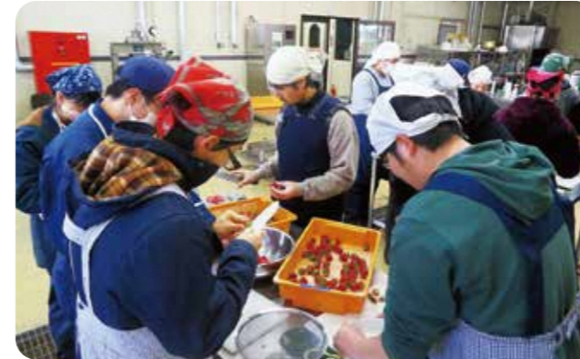
県産食材を用いたジャム加工体験

カレッジの専任指導員を始め、県の研究員・普及指導員、農業高校教員、先進農家、大学関係者、農業機械・ICT等の専門家などが講師を務めます。