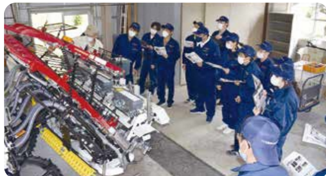
田植機の点検講習

演習機械：トラクタ、田植機、スマート農機など 資格取得：農耕用大型特殊自動車免許、刈払機取扱作業 者安全衛生教育講習、県農業機械士 など