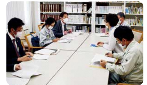
農林振興センター等との就農相談