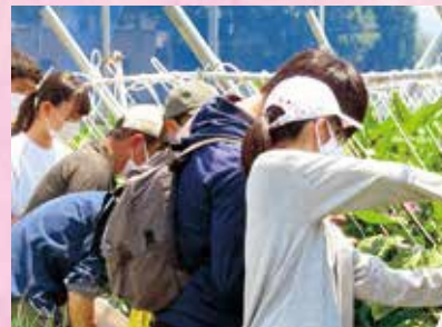
収穫作業体験の様子

日時：令和6年7月21日(日) 午前9:30～11:40 場所：とやま農業未来カレッジ 月岡キャンパス