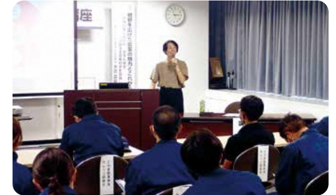
農業の魅力を発信する女性経営者による公開講座