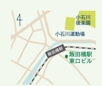
JR 中央・総武線 飯田橋駅より徒歩2分 東京メトロ東西線・有楽町線・南北線 飯田橋駅より徒歩2～3分 都営地下鉄大江戸線 飯田橋駅より徒歩2～3分

🕒 10:00～18:30 📅 日・祝日、年末年始 〒102-0072 東京都千代田区飯田橋3-6-5 飯田橋駅東口ビル1階