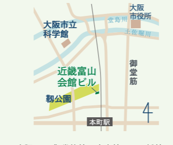
大阪メトロ御堂筋線・中央線・四つ橋線 本町駅 2番または 28番出口から徒歩数分 第4土曜は、大阪ふるさと暮らし情報センターにて、出張相談会を実施しています。

🕒 10:00～18:00 📅 日・祝日、年末年始 〒550-0004 大阪府大阪市西区 靱本町1-9-15 近畿富山会館内