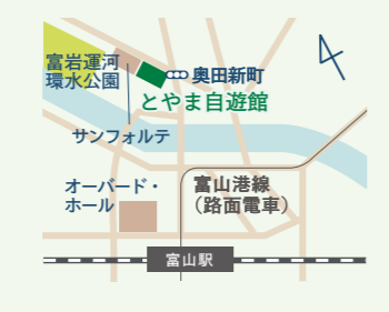
富山駅北口より徒歩5分

🕒 9:30～17:00 📅 日・祝日、年末年始 県内での現地案内など、ご予約をいただいた場合は休日でも対応します。事前にご相談ください。 〒930-0805 富山県富山市 湊入船町9-1 とやま自遊館 2F 富山県人材活躍推進センター内