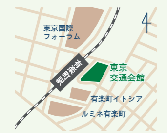
有楽町駅より徒歩1分

🕒 10:00～18:00 📅 月・祝日、年末年始 〒100-0006 東京都千代田区有楽町2-10-1 東京交通会館8F NPO法人 ふるさと回帰支援センター内