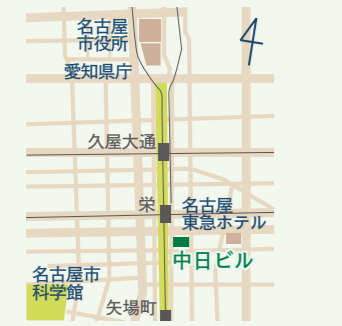
地下鉄栄駅より徒歩5分

🕒 8:30～17:15 📅 土・日・祝日、年末年始 〒460-0008 愛知県名古屋市 中区栄4-1-1 中日ビル5階 富山県名古屋事務所内