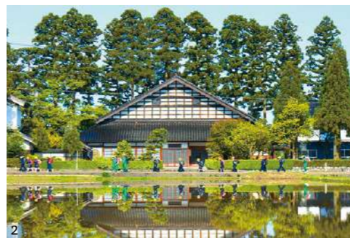
1. 日本一の大きさを誇る砺波平野の散居村 2. 田園の中の伝統家屋「アズマダチ」