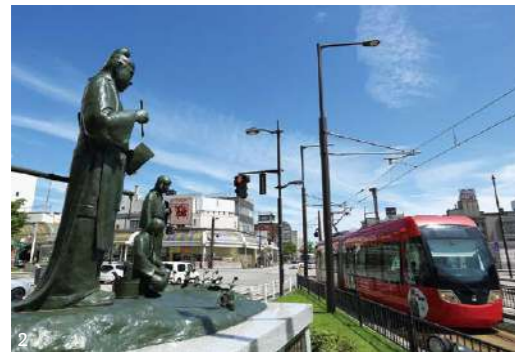
1. 移住者受入れモデル地域の金屋町では、移住した方が次々とお店をオープン 2. 万葉線の沿線では、生活に必要なものが全て揃う