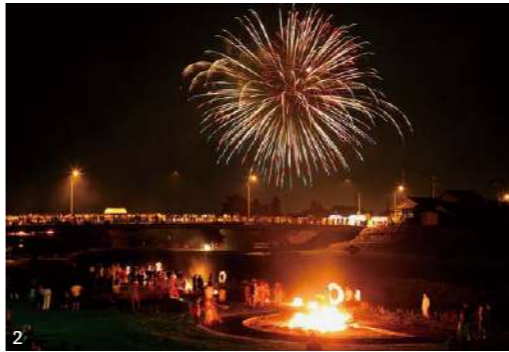
1. 町のシンボル「劔岳」と富山地方鉄道本線 2. お盆には上市川/河川敷で先祖の霊を迎える「しょうらいこ」が行われる