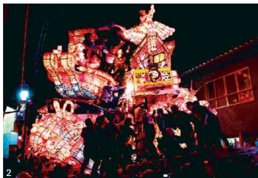
1. 菅沼合掌造り集落で行われる「春祭り」での親子獅子 2. 「福野夜高祭」は2017年にユネスコ「プロジェクト未来遺産」に登録