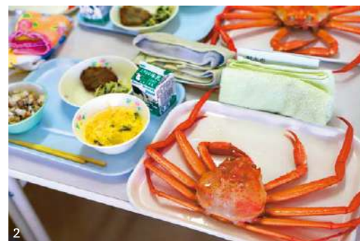
1. 新湊地区を流れる内川。人と川の暮らしがとても近い 2. 市内小学校6年生に提供される「カニ給食」