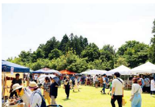
1. 商店街を歩き「立山小唄町流し」 2. 豊かな自然と手づくり品を満喫できるイベント「立山 Craft」