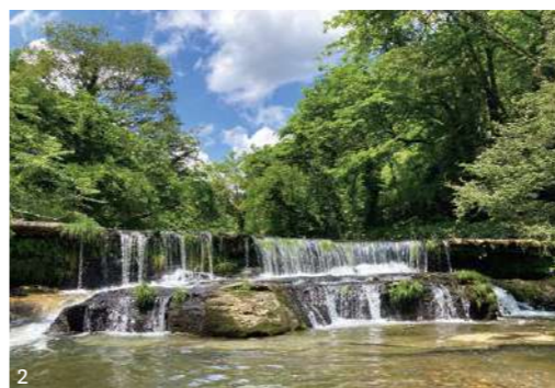
1. メルヘン建築の一つ、大谷中学校 2. 富山県指定天然記念物「おうけつ」を見ることが出来る