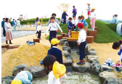
1. 図書館を併設した越中舟橋駅 2. 「オレンジパーク舟橋」内の、水汲みポンプのある水遊び場