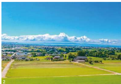
1. 多くの親子連れでにぎわう「東福寺野自然公園」のふわふわドーム 2. 山側から望む市街地と富山湾