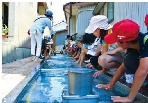
1. 田園風景のなかに佇む「黒部宇奈月温泉駅」 2. わき出す清水(しょうず)は生活の一部となっている