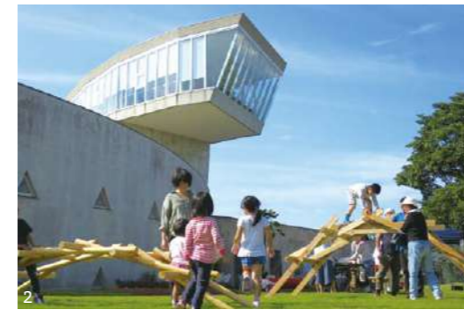
1. 里海・里山の豊かな恵みを両方受け取れる 2. 日本各地の海浜植物を中心に植栽展示する「海浜植物園」子どもも大人も一緒に遊べる