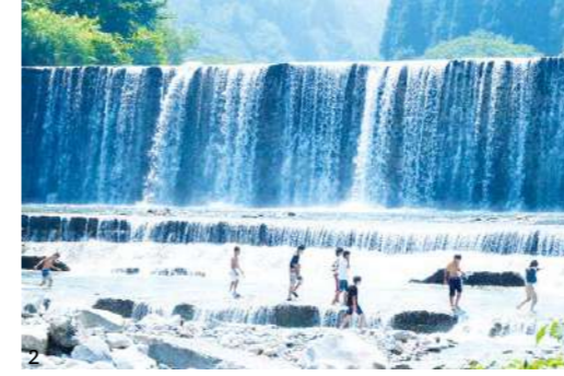
1. 水族館や遊園地などの多彩な施設がある総合公園「みらパーク」 2. 町部から車で10分の距離にある片貝山ノ守キャンプ場