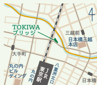
JR 東京駅日本橋口より徒歩3分 東京メトロ大手町駅 A4 出口より徒歩5分 東京メトロ三越前駅 B1 出口より徒歩3分

🕒 10:00 ~ 18:30 📅 日・祝日、年末年始 〒100-8228 東京都千代田区大手町2-7-1 TOKIWAブリッジ4F 区画409