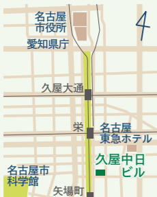
地下鉄栄駅より徒歩5分 地下鉄矢場町より徒歩4分

🕒 9:30 ~ 17:00 📅 土・日・祝日、年末年始 〒460-0008 愛知県名古屋市中区栄 4-16-36 久屋中日ビル 3F (富山県 名古屋事務所内)