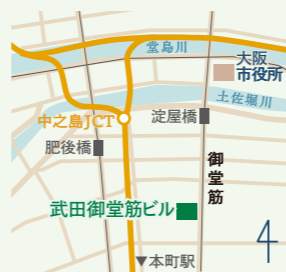
淀屋橋駅 13 番出口より徒歩2分 本町駅2番出口より徒歩6分