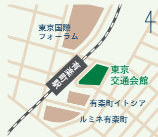
有楽町駅より徒歩1分

🕒 10:00 ~ 18:00 📅 月・祝日、年末年始 〒100-0006 東京都千代田区有楽町 2-10-1 東京交通会館8F NPO法人 ふるさと回帰支援センター内