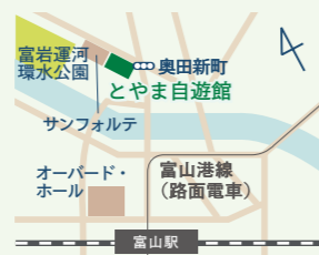
富山駅北口より徒歩5分

🕒 9:30 ~ 17:00 📅 日・祝日、年末年始 県内での現地案内など、ご予約をいただいた場合は休日でも対応します。事前にご相談ください。 〒930-0805 富山県富山市湊入船町 9-1 とやま自遊館 2F