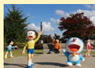
1.わくわくのアスレチックが充実 2.「ドラえもん」に出てくる空き地が再現されている©藤子プロ

花や緑に囲まれた公園。広々とした敷地内には大型遊具や展望台のほか、高岡出身の漫画家、藤子・F・不二雄氏の代表作『ドラえもん』のキャラクター像もあり家族で楽しめる。