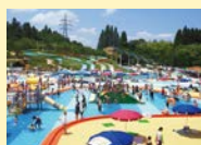
1.公園内を走るトレンにはベビーカーも乗せられる 2.夏は家族で楽しめるプールが大人気

広大な園内に、巨大な屋内遊具やものづくりがたっぷり楽しめる「こどもみらい館」をはじめ、芝生広場、バーベキューコーナー、ボートや展望塔など好奇心を刺激する施設が充実。